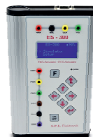
S.P.L. - Simulatoren